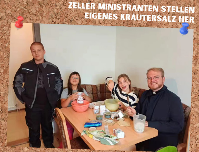
ZELLER MINISTRANTEN STELLEN EIGENES KRÄUTERSALZ HER