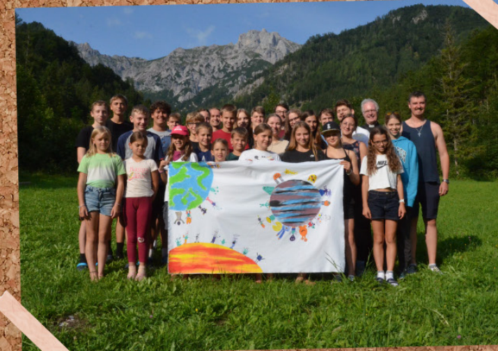
WAIDHOFNER MINILAGER IN HALL BEI ADMONT