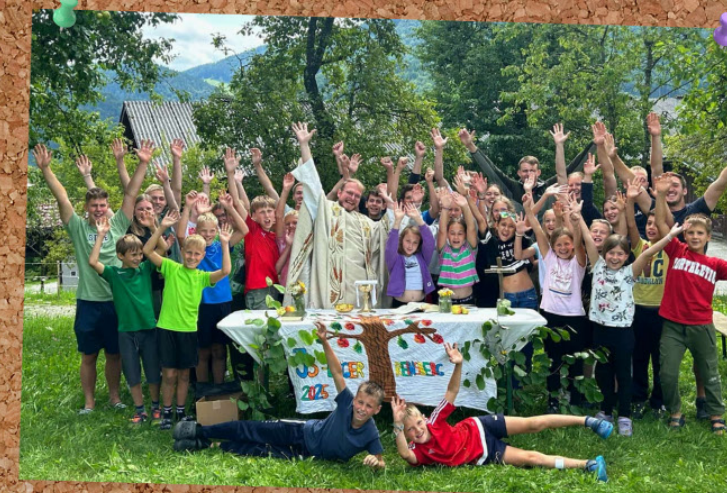
KONRADSHIMER JUNGSCARLAGER IN REINSBERG