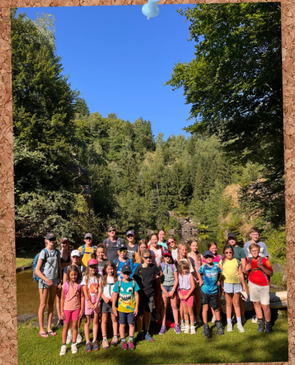
BÖHLERWERKER JUNGSCARLAGER IN GLOXWALD