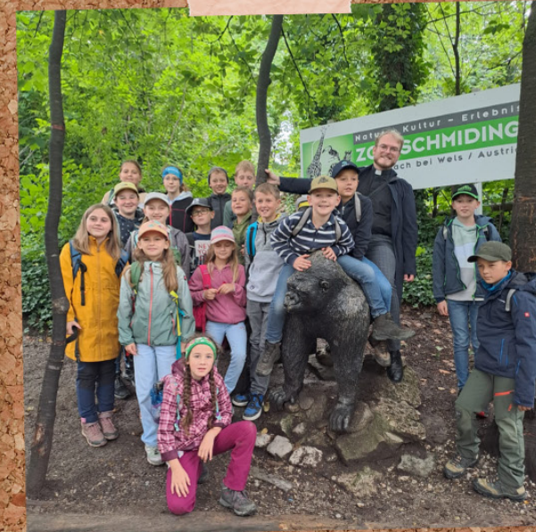
LEONHARDER MINISTRANTENAUSFLUG IN DEN ZOO SCHMIDING